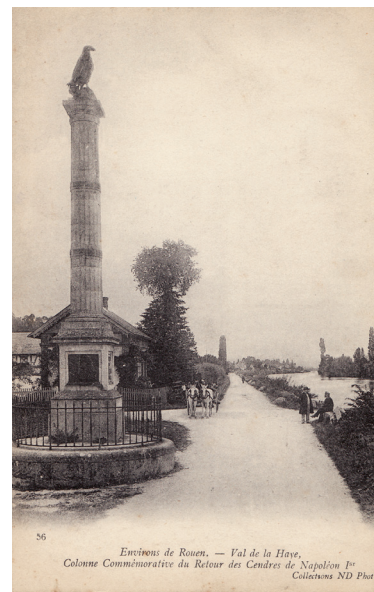
56 Enclos de Rouen. — Val de la Haye. Colonne Commémorative du Retour des Cendres de Napoléon I er Colonne ND Phat

Elle permettra de transmettre la mémoire de cet événement : elle organisera toute manifestation qui y contribuera. D'une façon générale son objet est : restaurer, préserver, entretenir, conserver, valoriser, enrichir, promouvoir, le patrimoine napoléonien du Val de la Haye. Un dépliant d'information sur le monument est disponible en Mairie, et un panneau d'information sera bientôt implanté sur le site.